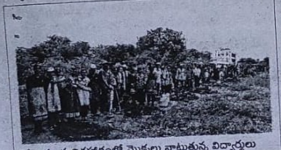
కోదాడ : హరితహారంలో మొక్కలు నాటుతున్న విద్యార్థులు